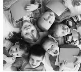
Clases de español: Kindergarten y primaria