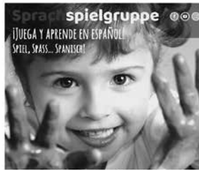
Grupo de juego y Mini Elki