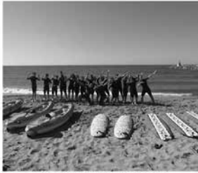
Campamentos en España