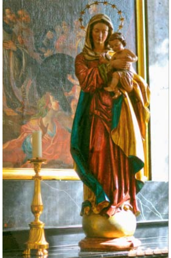
MARIA MADRE DE EUROPA