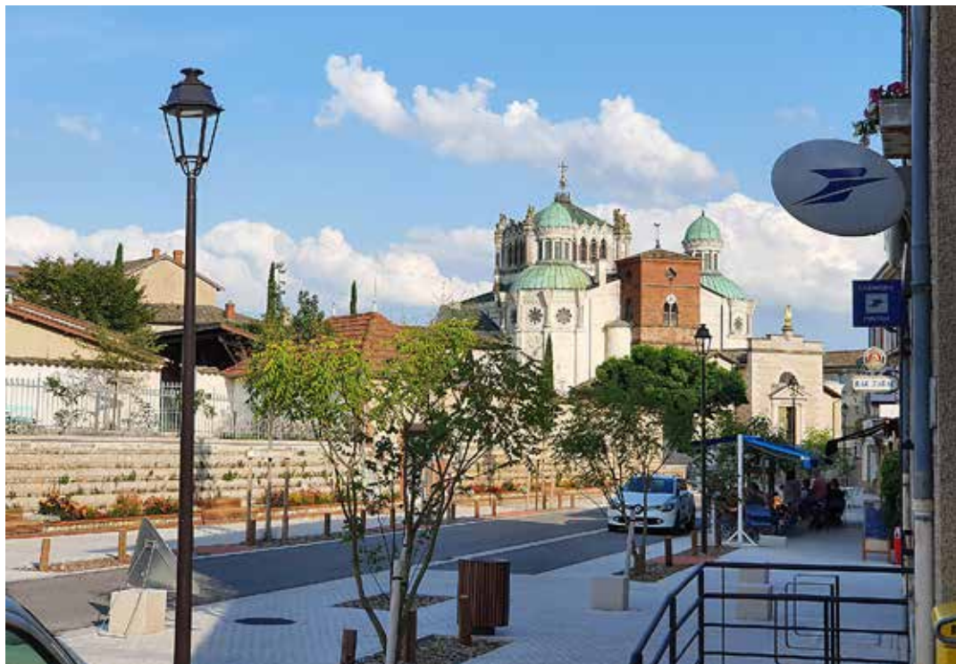
Vista del Santuario de Ars-sur-Formans y de la antigua iglesia parroquial en la que ejerció su ministerio el santo cura san Juan María Vianney.