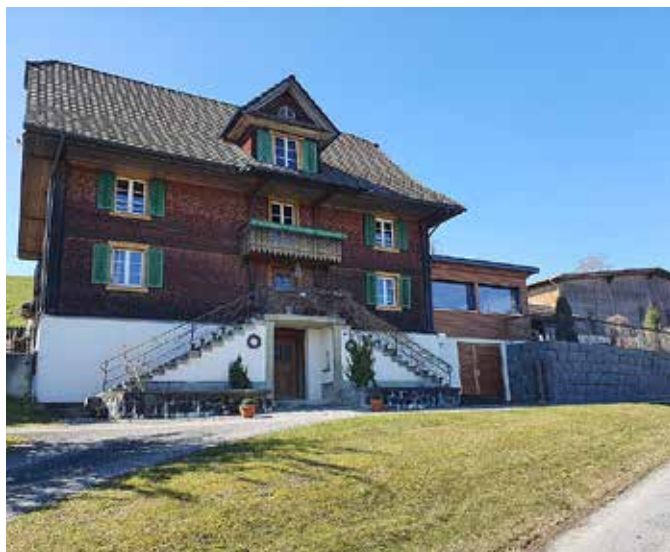
Casa natal de Niklaus Wolf en Unterliding

Me interesé por su vida y, días más tarde, hice una pequeña peregrinación a pie desde la estación de tren de Sempach- Neuenkirch hasta Unterliding (el lugar donde nació y donde se conserva la casa de sus padres), luego a Rippertschwand (el lugar donde vivió y donde también se conserva su casa) pasando por Neuenkirch y regresando a la estación para tomar el tren de regreso a Lucerna, no sin antes visitar la sorprendente capilla de Adelwill muy cerca de la estación de Sempach.