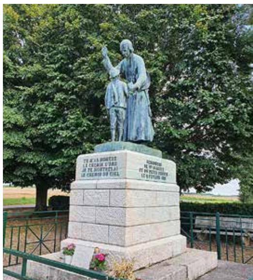
Primer encuentro del santo cura con un futuro feligrés, el pastorcillo Antoine Givre, en las afueras del pueblo: “Tu me has mostrado el camino de Ars, yo te enseñaré el camino del cielo”.