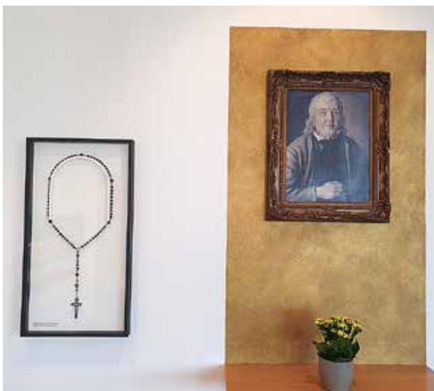
Retrato de Niklaus Wolf que se encuentra en la capilla inferior de la iglesia de Neuenkirch. Y junto al retrato, su rosario ¡de 6 misterios!.

Una tarde del mes de marzo, de regreso de una visita al monasterio de St. Urban me llevaron a la iglesia de Neuenkirch para que “conociera la tumba de un santo que no está canonizado oficialmente por la Iglesia pero sí por la gente”. Y allí supe de la existencia de Niklaus Wolf de Rippertschwand, el padre Wolf como le llaman muchos.