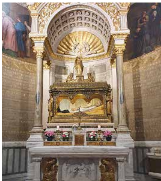
Capilla sur del santuario en la que se conserva incorrupto el cuerpo de san Juan María Vianney, patrono de los párrocos del mundo.