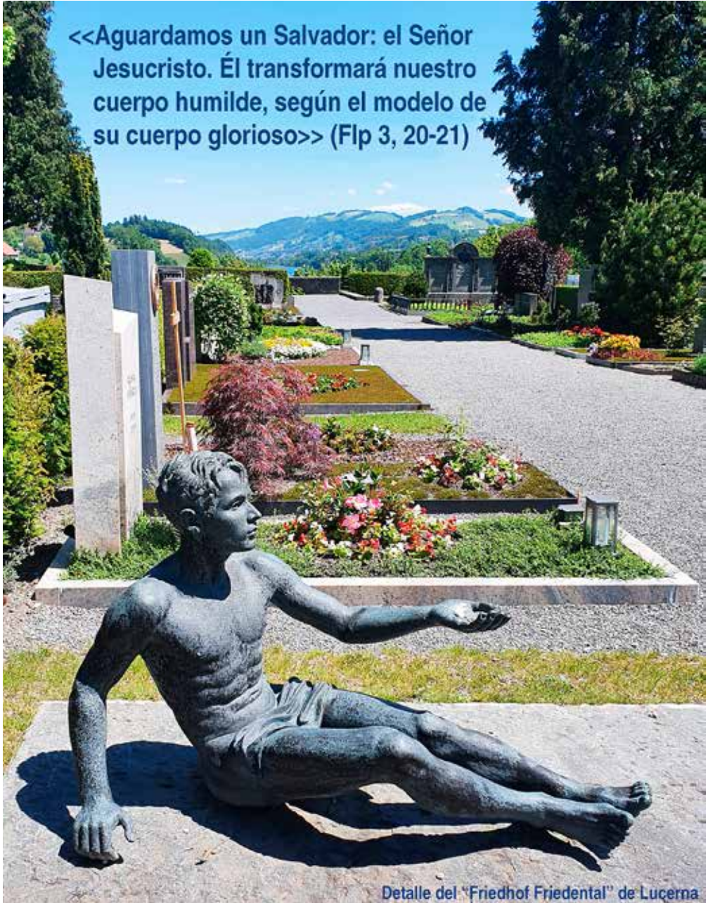
Detalle del "Friedhof Friedental" de Lucerna

Adressänderungen an: Spanier-Mission, Weyrstrasse 8, 6006 Luzern