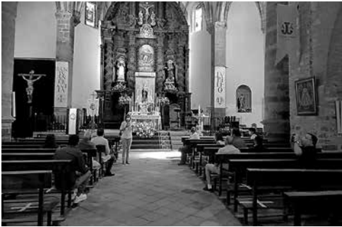
3 fotos de la izquierda: Isabel Fernández del Rio guía a los peregrinos en Almodovar del Campo (Ciudad Real)