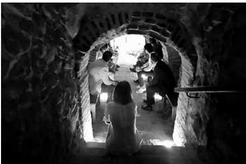
Foto Inferior: Primera Misa en español en Gut Hirt (Zug), el 26.09.2021