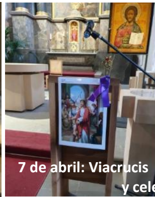
7 de abril: Viacrucis y celebración de la Pasión