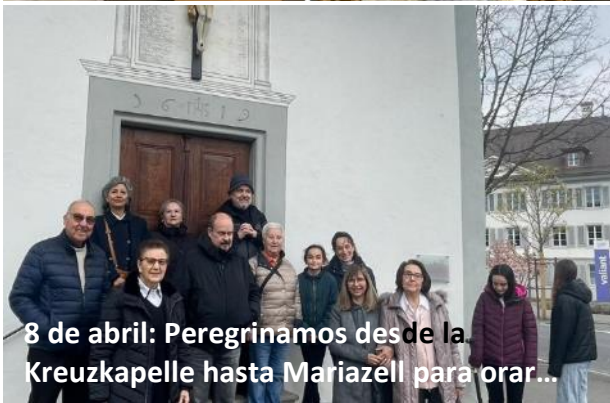
8 de abril: Peregrinamos desde la Kreuzkapelle hasta Mariazell para orar...