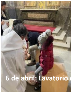
6 de abril: Lavatorio de los pies y Monumento