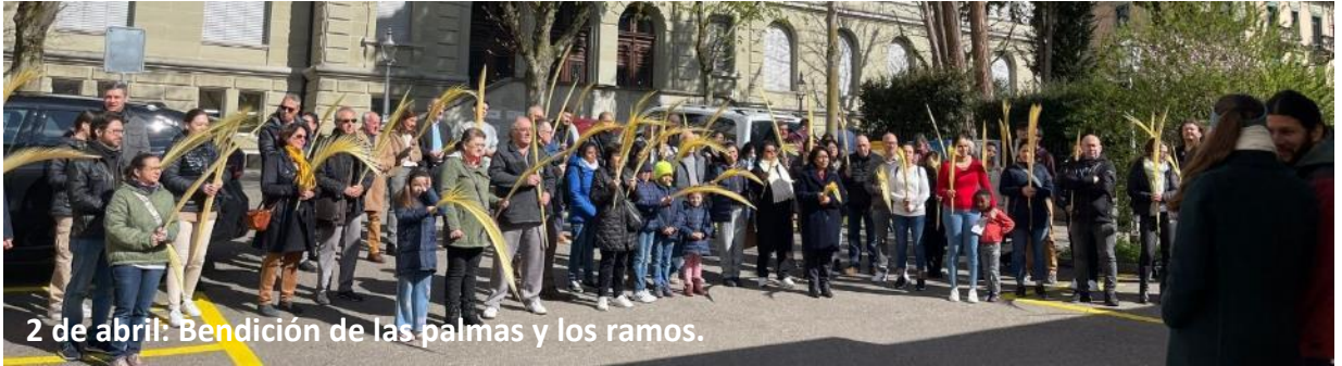
2 de abril: Bendición de las palmas y los ramos.

Del domingo 2 al domingo 9 de abril celebramos la Semana Santa. Las fotos recogen algunos momentos de las celebraciones de estos días santos.