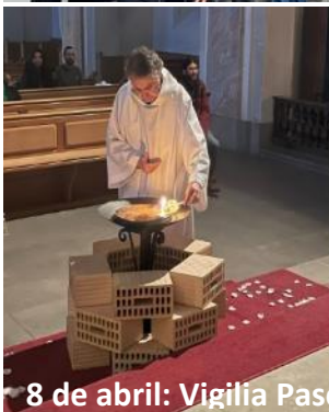
8 de abril: Vigilia Pascual