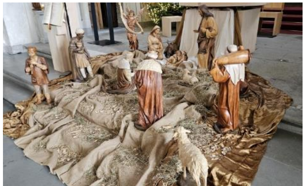
La adoración de los Magos, Mariahilf