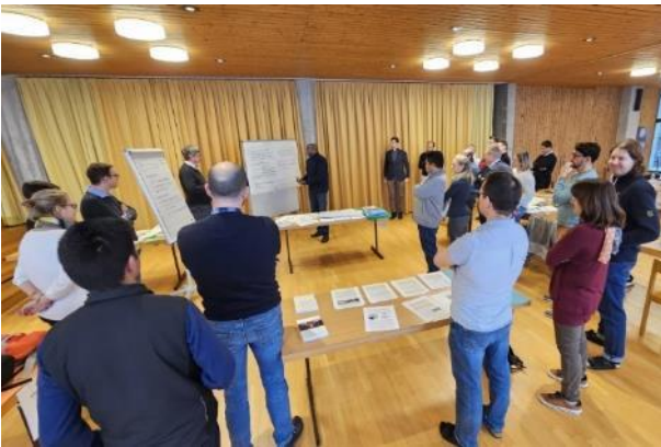
Momento de una de las sesiones de trabajo.