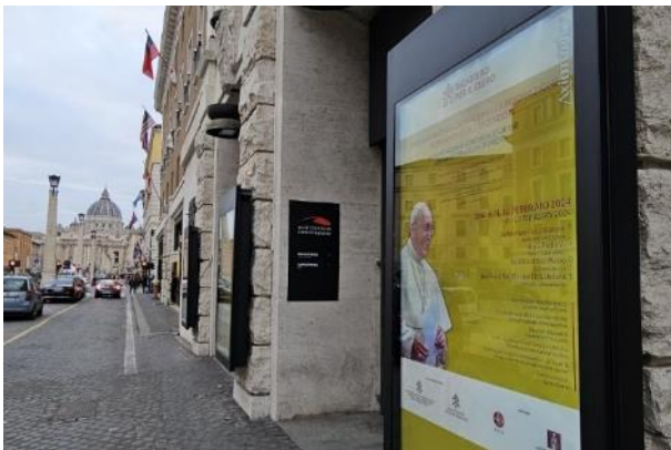
Auditorio de la Conciliación.