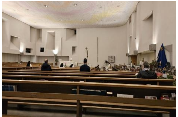
Capilla del Convento.

Domingo 21.01.2024 : En las misas de Sursee y Lucerna nos acompañaron dos hermanas de un grupo misionero que tiene su sede en Ginebra . Al final, desde el ambón, dieron un breve testimonio de su tarea y misión. Según su testimonio, se dedican a acompañar a ancianos que están solos, especialmente en el momento de su muerte. Tienen como referente a la Virgen María quien perseveró con Jesús, en su última agonía, al pie de la Cruz. Al final nos ofrecieron un librito para que nos ayude en nuestra vida de cristianos: « Crear con María ».