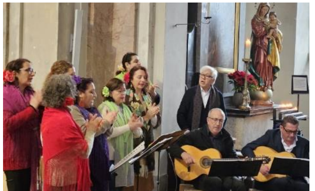
y villancicos del Coro Rociero de Lucerna.