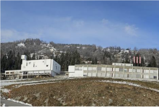
Convento de las Madres Dominicas de Illanz.