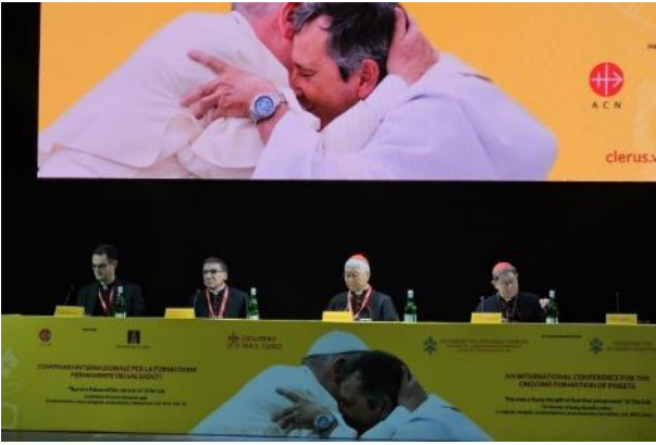
Sesión inaugural del Congreso.