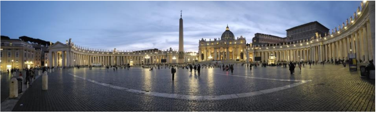
Plaza de San Pedro del Vaticano.