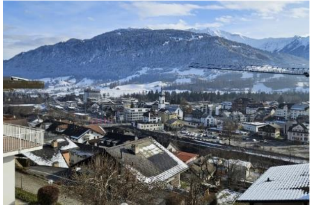
Vista de Illanz desde el convento.