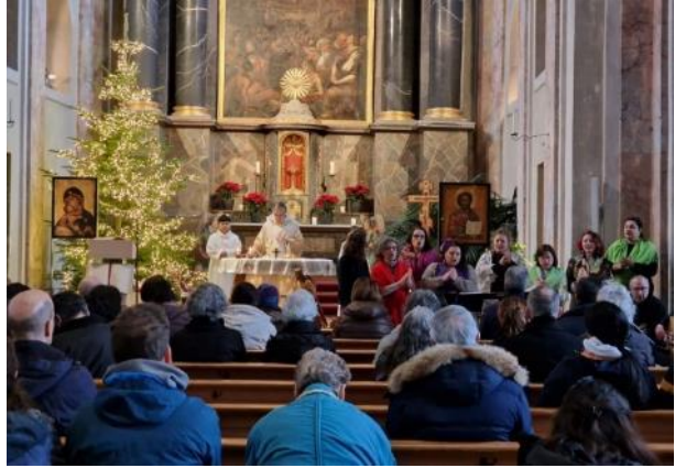
Eucaristía del domingo de Reyes con la participación del Coro Rociero de Lucerna.