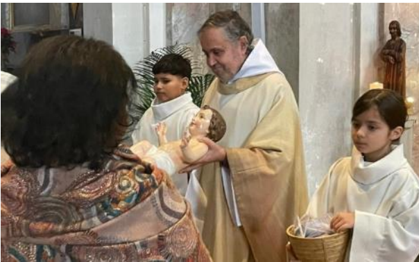
Adoración del Niño Jesús al final de la Misa...