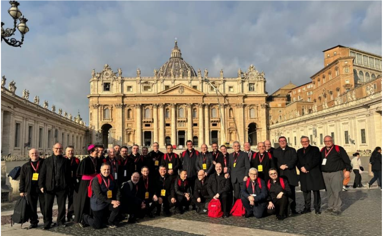
Sacerdotes españoles después de la audiencia con el papa Francisco.

Uno de los momentos más especiales del Congreso fue la audiencia con el Santo Padre, en la que estuvieron presentes todos los participantes en este encuentro. El papa Francisco, al hablar del fundamento de la formación permanente, señaló que «solo si somos y permanecemos discípulos, podremos llegar a ser ministros de Dios y misioneros de su Reino». En otro momento, el Pontífice advirtió que “cuando la mundanidad entra en el corazón del sacerdote, se arruina todo”, y reclamó sacerdotes «plenamente humanos, que sean capaces de jugar con los niños y de acariciar a los ancianos». (↓)