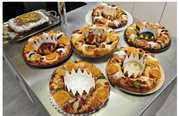
Los roscos de Reyes ya terminados y apetitosos, y un bizcocho de chocolate para los niños.