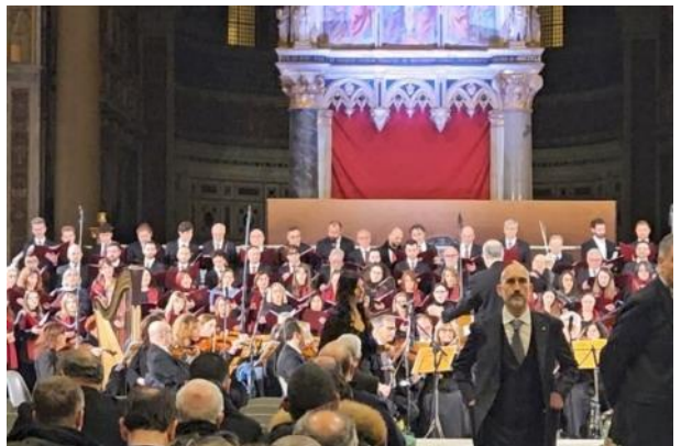
Concierto-meditación en San Juan de Letrán.