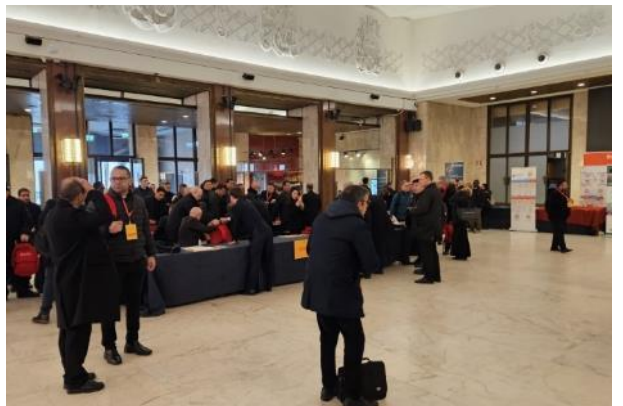
Llegada de los participantes en el Congreso.