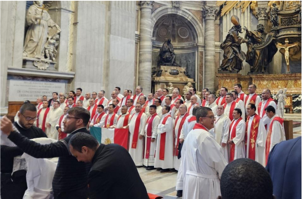
Grupo de sacerdotes mexicanos presentes en el Congreso.