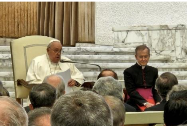
Audiencia con el papa Francisco.