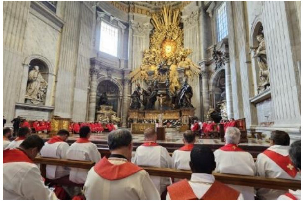
Misa de inauguración en la capilla de la Catedral.