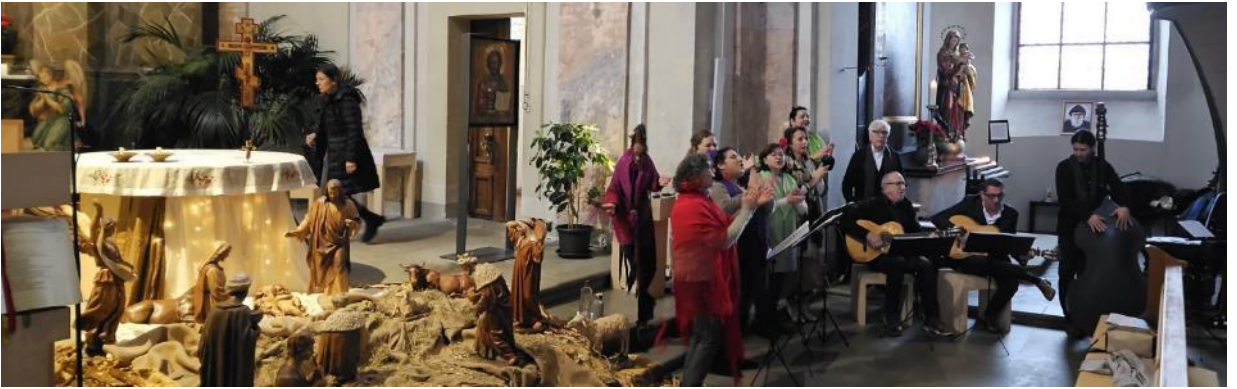
Ensayo antes de la Misa de Reyes