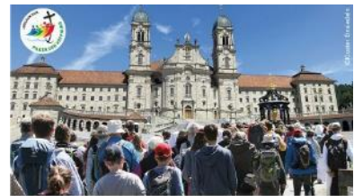
Nationale Wallfahrt Maria Einsiedeln 2025

16:00 Finalización del evento con la bendición a los peregrinos para el viaje de regreso.